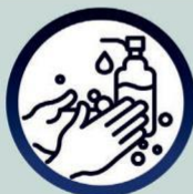
Le lavage des mains