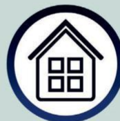
L'isolement à la maison si vous êtes malade